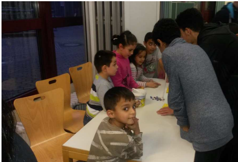
Das Anlaut-Bingo-Spiel konnte ausprobiert werden.

Als es endlich dunkel war, liefen wir mit unseren Laternen los.