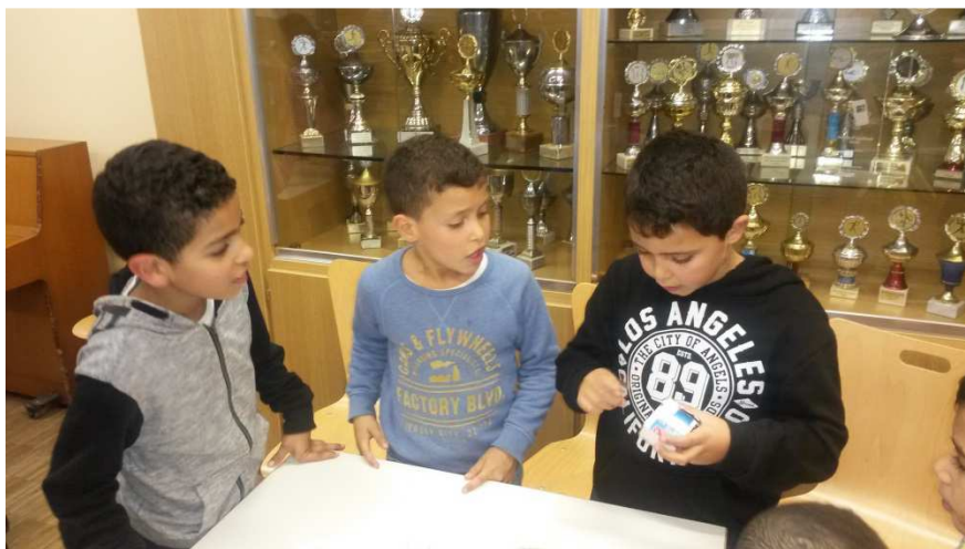
So zündet man eine Kerze sicher an.